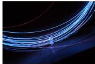
Fiber laser pumping