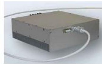
Solid state laser pumping