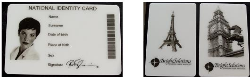
Grey Scale Images obtained using Pulse Energy Modulation