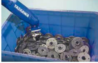
机器人路径规划以避免碰撞