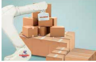
栈板多样箱型分类拆码垛