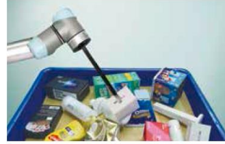
无需教导拾取未知工件杂货